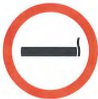
DOHÁNYZÁSRA KIJELELT HELY