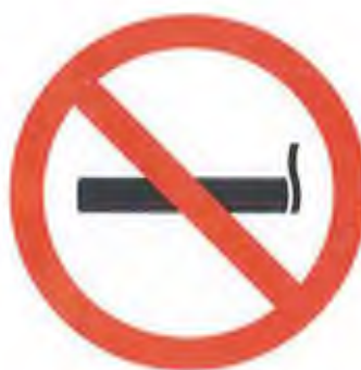
TILOS A DOHÁNYZÁS